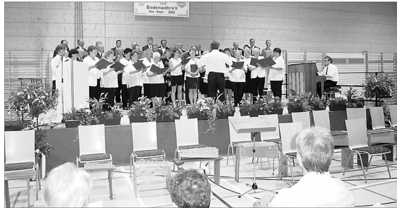
Der gemischte Chor, bestehend aus dem MGV und dem Frauensingkreis.

Zum Abschluss des Chorkonzerts gab es eine Hommage an die Comedian Harmonists. Der Gemischte Chor, bestehend aus dem Frauensingkreis und dem MGV-Chor, erinnerte mit zwei Liedern an diese Musikgrup-