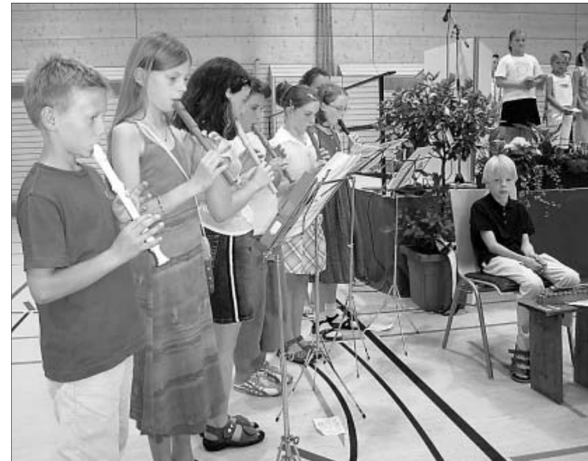
Die Flötengruppe der Volksschule bot ein sehr ansprechendes Programm.

Zum Abschluss galt auch dem Moderator des Konzertabends, MGV-Ehrenmitglied und Chronist Heribert Braun, Anerkennung, der mit wohlgesetzten Worten aber auch mit der ihm eigenen Ausdrucksweise humorvoll und kurzweilig durch das Programm führte.